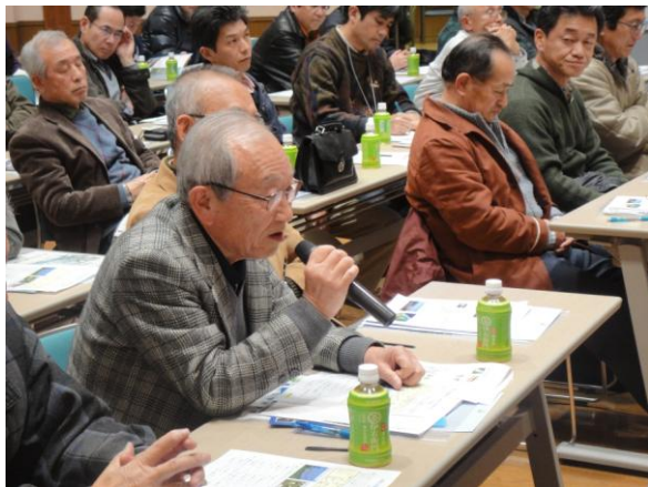
意見交換会の様子