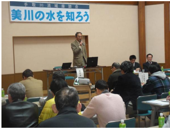
開会挨拶および事業紹介